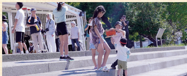
島と陸を赤い糸を持ってつないでいる様子