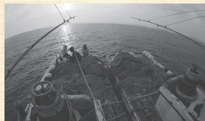
W・ユージン・スミス

つなぎ美術館 〒869-5603 熊本県葦北郡津奈木町大字岩城494 ☎0966-61-2222 FAX 0966-61-2223