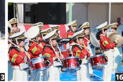
【写真説明】 8_18_ハリウッドザコシショウさんとだーりんずのネタに会場は大爆笑／9_体育館ではさまざまな手芸品や生け花が展示／10_優しい歌声を披露したさだまさかさん／11_くまモンのステージ中に迷子のハプニング。お母さんと会えて安心／12_司会の2人も成り行きでダンス。会場は大盛り上がり／13_狙いを定めてモルックを投げる／14_香ばしい香りがただよう／15_ブリを捕まえてご満悦／16_園児たちのかわいらしい演奏／17_やったね! 1等ゲット