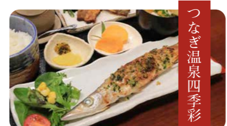
つなぎ温泉四季彩

カマス定食(天ぷらorフライ) 1600円 営業時間/11時～13時半、17時～21時半 定休日/水曜、日曜昼 TEL/0966-78-4493