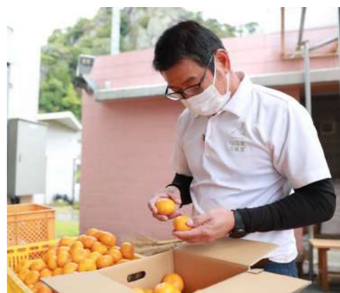
心を込めて育てた農産物のおいしさを損なわないよう、従業員が果実の着色具合や傷の有無などを目視で一つひとつ丁寧に確認。

愛情込めて育てた農産物だけでなく、作り手の思いも一緒に届けることが私たちの役目。農家と一体になって、津奈木の良さを少しでも多くのお客さんに知ってもらえるよう、つなぎFARMの魅力を発信し続けていきたいです。