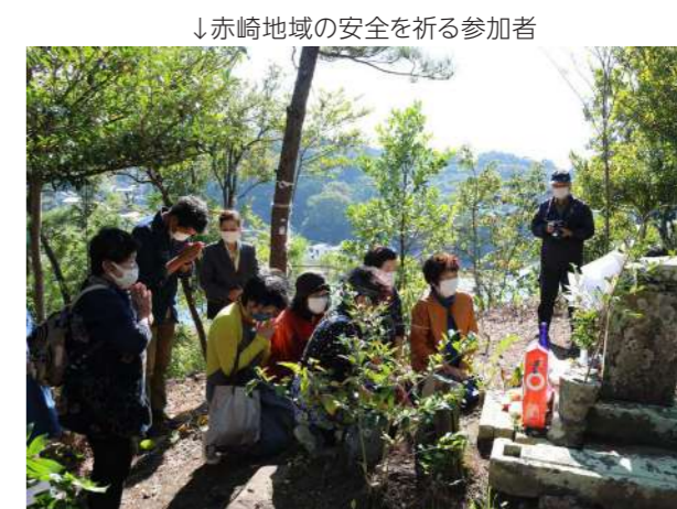
↓赤崎地域の安全を祈る参加者