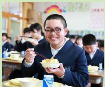
おいしい学校給食に子どもたちも笑顔