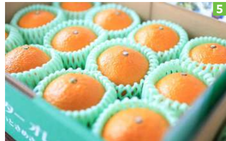
【写真説明】1. 青々としたスイートスプリング/ 2. 勉強会に何度も参加し、技術向上に努める/ 3. 不知火海を見下ろす急斜面で育てる/ 4. 果汁たっぷりですりやかな香りが広がる/ 5. 完熟スイートスプリング。通販サイトでも販売し、全国から注文が寄せられる