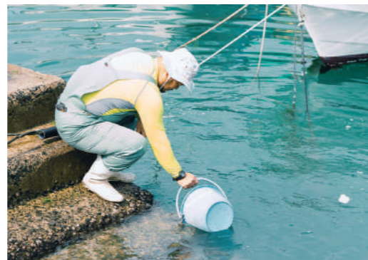
足りないミネラルは海水を薄くして散布

時間がかかり、形も不ぞろい になることもある有機栽培。そ れでも続ける理由を4人に尋ね