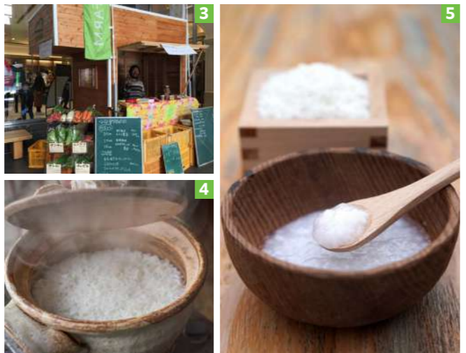
【写真説明】1. 耕作放棄を解消した田んぼで開いた自然栽培米ワークショップ/ 2. つなぎ FARM オーガニック映画祭を自ら企画/ 3. 大工の協力で移動販売車を製作/ 4. 無肥料・無農薬の米を土鍋で炊く。口の中にやさしい味わいが広がる/ 5. 離乳食「あんしんまんま」。おかゆや野菜をペーストにして食べやすくした

てもらえない。自然栽培を一人で始めるのはかなりハードルが高かった」と途方に暮れていた小野さん。そのときに津奈木町が、町をあげて長期的に持続可能な農業に取り組んでいることを知り、すぐに