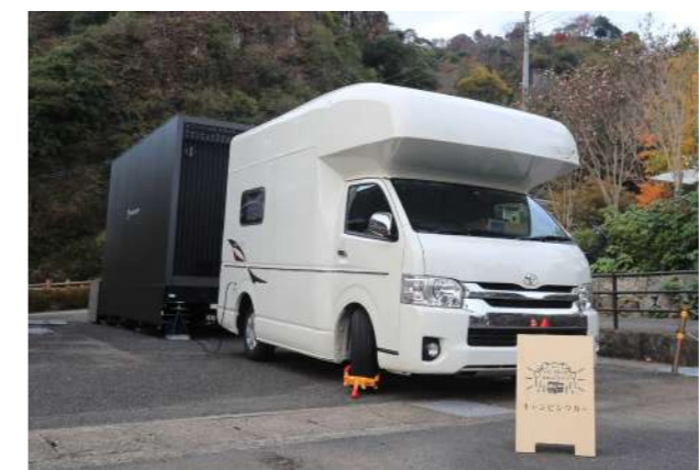
↑津奈木で特別な宿泊とワーケーションをお楽しみください

つなぎ温泉「四季彩」やつなぎ百貨堂の広場、役場を活用し、宿泊とワーケーション（仕事・休暇）の実証実験が11月23日(火)から行われています。キャンピングカーや車で移動・移設できる「トレーラーハウス」など4つから選べ、温泉やたき火、野外リビングなども利用でき、町の魅力を体感できます。詳しい内容や予約方法などは次のページをご覧ください。