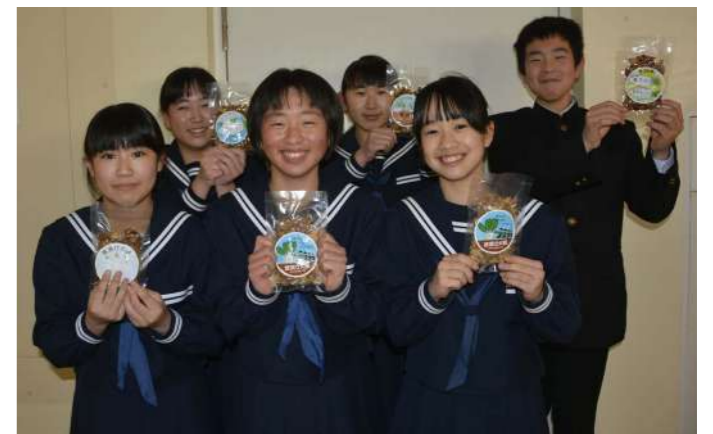
寒漬大根の商品ラベルを中学生がデザイン

津奈木町では農家などと協力し、小中学生に農業体験を実施。明日を生きる子どもたちの生きた学びの場となっています。2人の小中学生に農業体験の感想、指導している農家からこの取り組みに対する思いなどを聞きました。