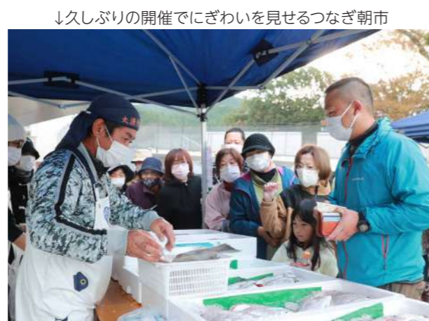
↓久しぶりの開催でにぎわいを見せるつなぎ朝市