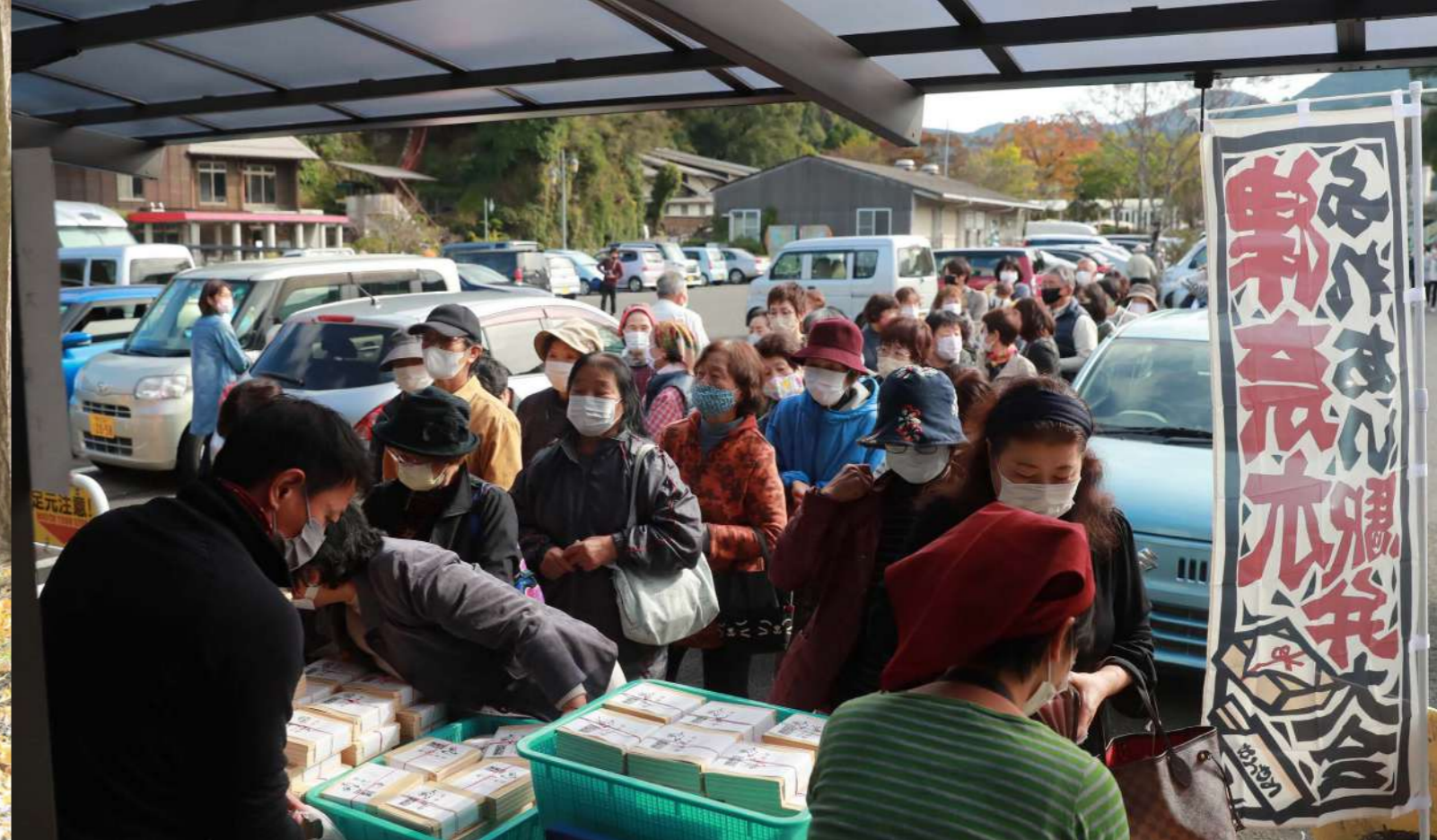
駅弁を買いにたくさんの人でにぎわう、ふれあいの店