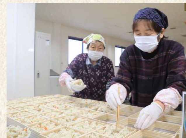
1 12 ご飯やもちを詰めるつなぎスローフードとJAあしきた女性部津奈木支部 / 3 駅弁などを買った人に景品が当たるガラポン抽選 / 4 折り詰めや掛け紙にもこだわった高級感のある駅弁