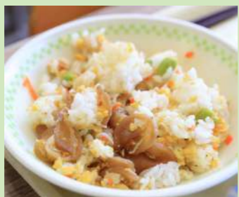
中学生が収穫した大根は「寒漬チャーハン」として提供

子どもたちが自らが苗植えや草取り、収穫までしたサラダ玉ねぎや寒漬大根もメニューに取り入れられ、農業への関心も高まるきっかけになっています。学校給食で使ったら、子どもから喜びの声があったそうです。人を良くすると書いて「食」。食べることは私たちの生活に欠かせないもの。楽しく元気の食事が未来につながる、津奈木らしいおいしい学校給食をお届けしていきます。