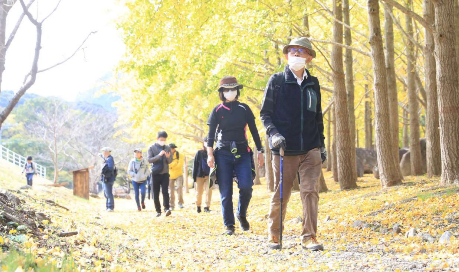
イチョウの木々が茂る小道を歩く参加者たち。津奈木町の自然とアートをめぐりました