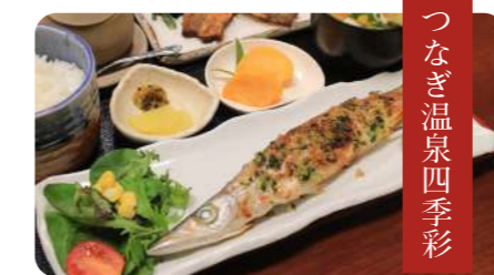
つなぎ温泉四季彩

カマス定食 (天ぷらorフライ) 1600円 営業時間/11時～13時半、17時～21時半 定休日/水曜、日曜昼 TEL/0966-78-4493