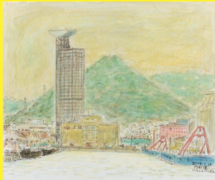
《門司港風景、ノーフォーク広場から》2014年 水彩 38.0×45.5cm 作家蔵