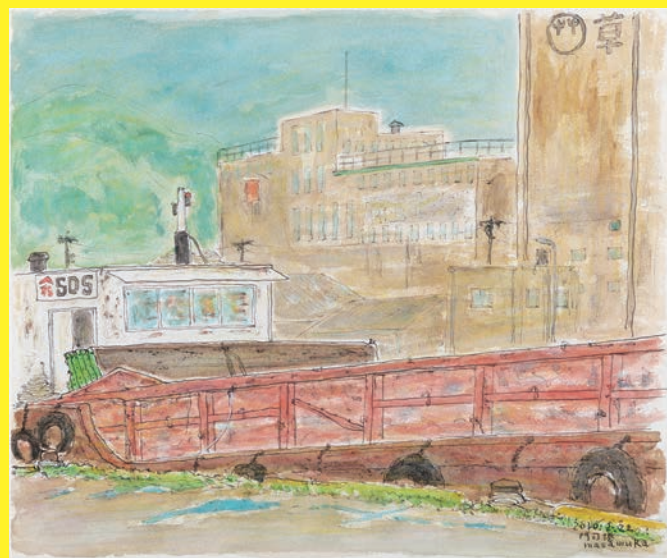
《門司港、いつもの岸壁》2010年 水彩 38.0×45.5cm 作家蔵