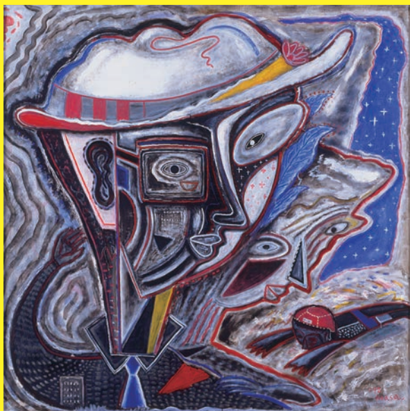
《浜辺にて》1992年 油彩 162.0×162.0cm 作家蔵