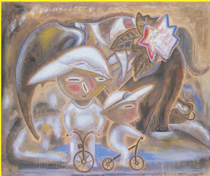
《誕生日》2010年 油彩 162.0×194.0cm 作家蔵