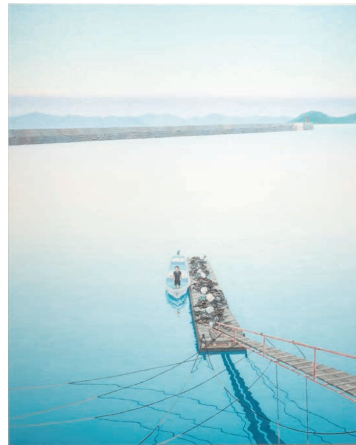
《海と子供の光景の肖像》加茂昂 2017年 つなぎ美術館蔵

〒869-5603 熊本県葦北郡津奈木町岩城494 TEL:0966-61-2222 FAX:0966-61-2223 http://www.town.tsunagi.lg.jp/Museum/