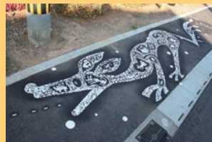
つなぎの根っこ 浅井裕介 2014~2017年

つなぎ美術館は、熊本県水俣・葦北地域における文化芸術活動の拠点として2001年4月に開館した津奈木町立の美術館です。第二次海老原美術研究所の所長を務めた境野一之をはじめとする熊本県ゆかりの作家による作品やタイ山岳民族の衣装など約450点を収蔵しています。