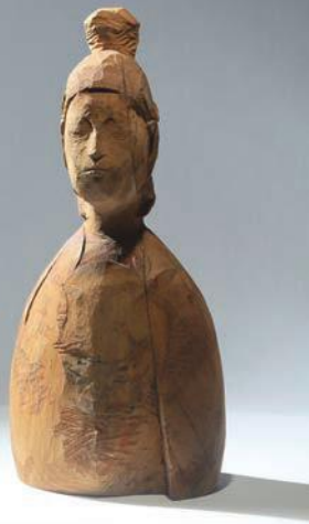
《Re:build》2017年 樟・彩色 H60×W28×D19(cm)