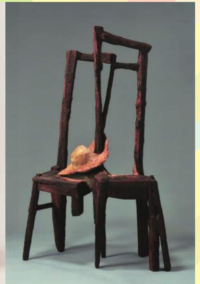
《世界の方角 - 私は未来-》2012年 樟・レッドシダー・彩色 H185×W120×D60(cm)

1977年、熊本県に生まれた森英顕は、崇城大学大学院修了後に筑波大学大学院で彫刻を学びました。熊本市内にアトリエを構えた現在も定期的に都市部で作品の発表を続けるなど、精力的に制作に取り組んでいます。木彫を中心とした伝統的な技法や表現を踏まえたうえで、実験的な作品にも挑む姿勢は、気鋭の作家として高い評価を得ています。幼少の頃から好きだったものづくりの夢が叶い、彫刻家としての道を着実に歩む森ですが、そのまなざしは常に夢幻の境を彷徨うかのように新たなモチーフへと向けられています。本展では新作を交えながら森の作家としての原点を辿ります。