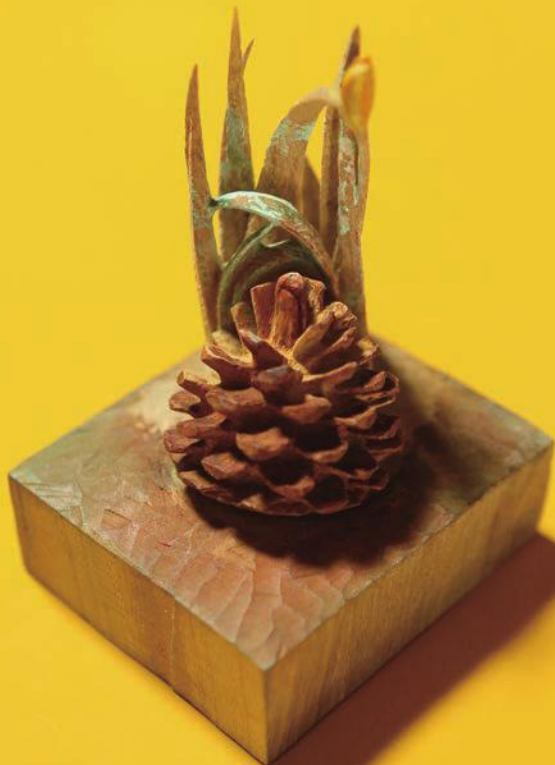
《記憶の波紋 - 緑のたより-》2014年 樟・彩色 H13×W10×D9(cm)

肥薩おれんじ鉄道／津奈木駅から徒歩10分 南九州西回り自動車道／芦北I.C.から車で20分 津奈木I.C.から車で3分 JR九州新幹線／新水俣駅から車で10分