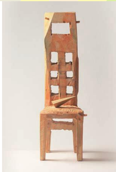
《I Have a Dream》2015年 樟・彩色 H68×W23×D22(cm)