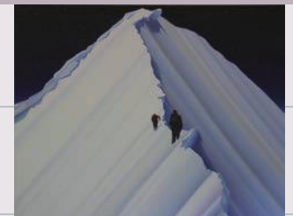
《目路とバグ34(ゾーン)》2012年 作家蔵 ※参考作品