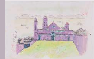
《伊太利アッジ》1982年 つなぎ美術館蔵