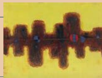
《水影》1980年代 つなぎ美術館蔵

2/24(土)~4/15(日) 境野一之展 抽象世界へのいざない'18(収蔵品)