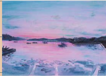
《若手県宮古湾夕暮れ》2017年 作家蔵

4/29(土・祝)~7/17(月・祝) 東日本から熊本へ 3月11日から始めたこと 小池アミイゴ展