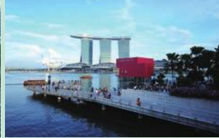
《The Merlion Hotel》2011 ※参考作品