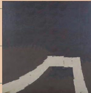
《城》坂本善三 1971年 つなぎ美術館蔵