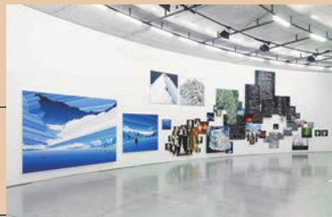
《事象と心象のドキュメンタリー》2015年 作家蔵 ※参考作品